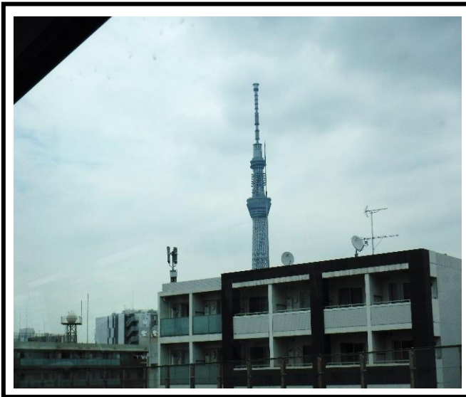
「車窓からの東京スカイツリー」 展望台へあがり、クラスのみinnと記念撮影。東京を一望しました。

令和6年6月25日（火）～27日（木）の2泊3日で修学旅行に行ってきました。BumB 東京スポーツ文化館に宿泊し、東京スカイツリー、しながわ水族館、日本科学未来館を見学しました。