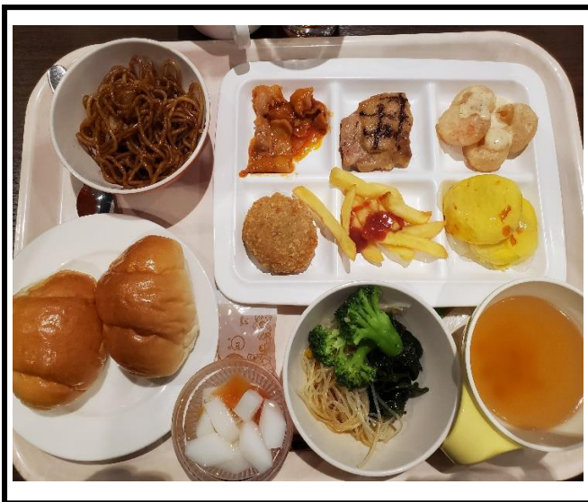
「宿舎の食事 <buffet形式>」 和食や洋食、中華など。自分の好みの料理を選んでいただきました。