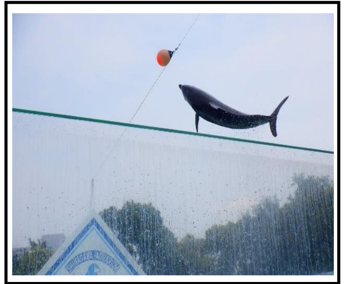
「しながわ水族館<イルカショー>」 とても高くジャンプするイルカたち。迫力満点のイルカショーを楽しみました。