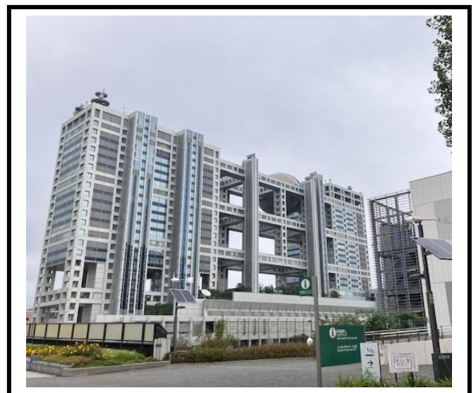
「フジテレビ」 管内のショップでお土産を買いました。キーホルダーやクリアファイルなど、欲しいものを自分で選び、購入しました。