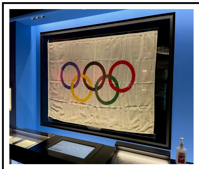
「日本オリンピックミュージアム」 体験活動を通して、オリンピアの凄さや競技の難しさを肌で感じることができました。