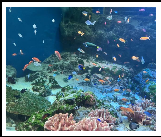
「マクセルアクアパーク品川」 色とりどりの海の生き物をたくさん見学しました。

10月16日（水）～10月18日（金）の2泊3日で移動教室に行ってきました。事前学習で学んだことを活かして、ルールを守って行動し、友達と協力しながら楽しく活動することができました。