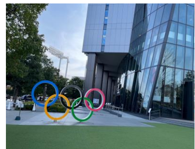
【オリンピックミュージアム】