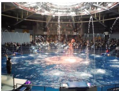
【アクアパーク品川】

3日間を通して、たくさんの楽しい思い出を作ることができました。天候にも恵まれ、普段体験することのできない経験を通じて、改めて友達と過ごす楽しさや協力する大切さなどを学ぶことができました。同時に「自分のことは自分で行う」ことの喜びを知る、良い機会となりました。この経験を活かし、来年度の修学旅行につなげていければと思います。