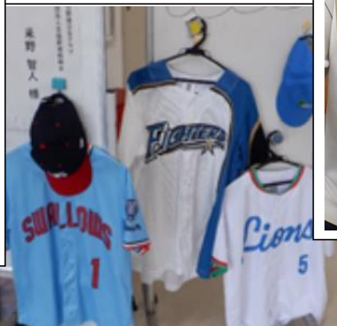
〔米野選手のユニフォーム〕