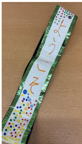
扉案内人のたすき キラキラのテープとたくさんのシールを貼って華やかにしました。