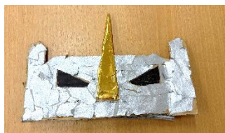
サイのお面 角の色を金色にして、力強さを表現しました。