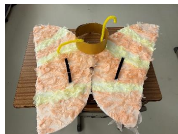
蝶の羽と触角 3人それぞれ色違いの蝶の羽で鮮やかになりました。