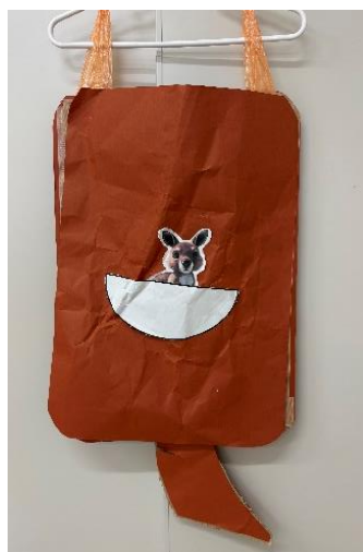
カンガルーの服 子カンガルーをつけて、よりカンガルーの衣装になりました。