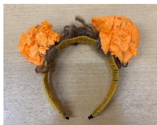
ライオンカチューシャ カチューシャに毛糸とお花紙を付け、仕上げました。