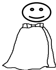
タオル(小学部はラップタオル推奨)