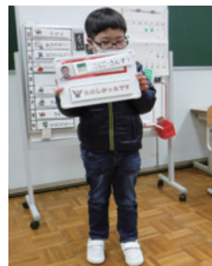
日常生活の指導 (帰りの会)

副籍交流とは、特別支援学校の小学部・中学部に在籍する児童・生徒が、居住する地域の小・中学校に副次的な籍をもち、直接的・間接的な交流を通じて、居住する地域とのつながりの維持・継続を図る制度です。